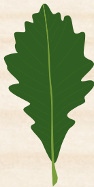
ROBLE BLANCO DEL PANTANO