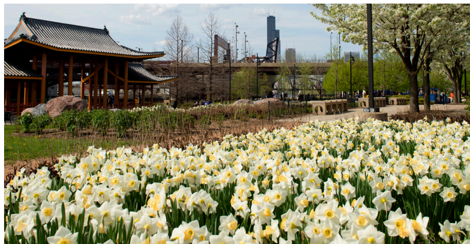
Los biosólidos del MWRD, una alternativa sostenible a los fertilizantes químicos, ayudan a embellecer el Ping Tom Park, del Distrito de Parques de Chicago.