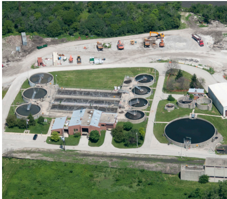
Planta de Tratamiento de Agua Lemont

La Planta de Tratamiento de Agua Lemont (WRP, por sus siglas en inglés) es una de las siete plantas de tratamiento de aguas residuales que posee y opera el Metropolitan Water Reclamation District of Greater Chicago (MWRD). El MWRD es la agencia de tratamiento de aguas residuales y manejo de aguas pluviales para la ciudad de Chicago y 125 comunidades del Condado de Cook. Trabajamos todos los días para mitigar las inundaciones y convertir las aguas residuales en recursos valiosos como agua limpia, fósforo, biosólidos y gas natural.