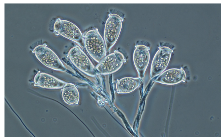
Los microbios como estos protozoos ciliados ayudan a eliminar las bacterias y el material orgánico del agua durante el tratamiento secundario.

¿Cómo sabemos que estamos haciendo un buen trabajo? Las plantas de tratamiento de aguas residuales están reguladas por el programa de permisos del Sistema Nacional de Eliminación de Residuos Contaminantes (NPDES, por sus siglas en inglés), de la Agencia de Protección Ambiental. Los permisos del NPDES establecen rigurosos estándares que el agua de la planta debe cumplir. La Asociación Nacional de Agencias de Agua Limpia ha otorgado a Lemont WRP los más importantes galardones de la Asociación por el cumplimiento de estos estándares. También vemos los beneficios producidos por nuestro trabajo en una mayor actividad recreativa en las vías fluviales, como kayak y canotaje, la recuperación del hábitat acuático y aumentos en la cantidad de especies de peces. Estamos reduciendo el uso de energía en nuestras instalaciones, con el fin de reducir las emisiones de gases de efecto invernadero, y estamos recuperando valiosos recursos y expandiendo el uso de biosólidos en toda la región.